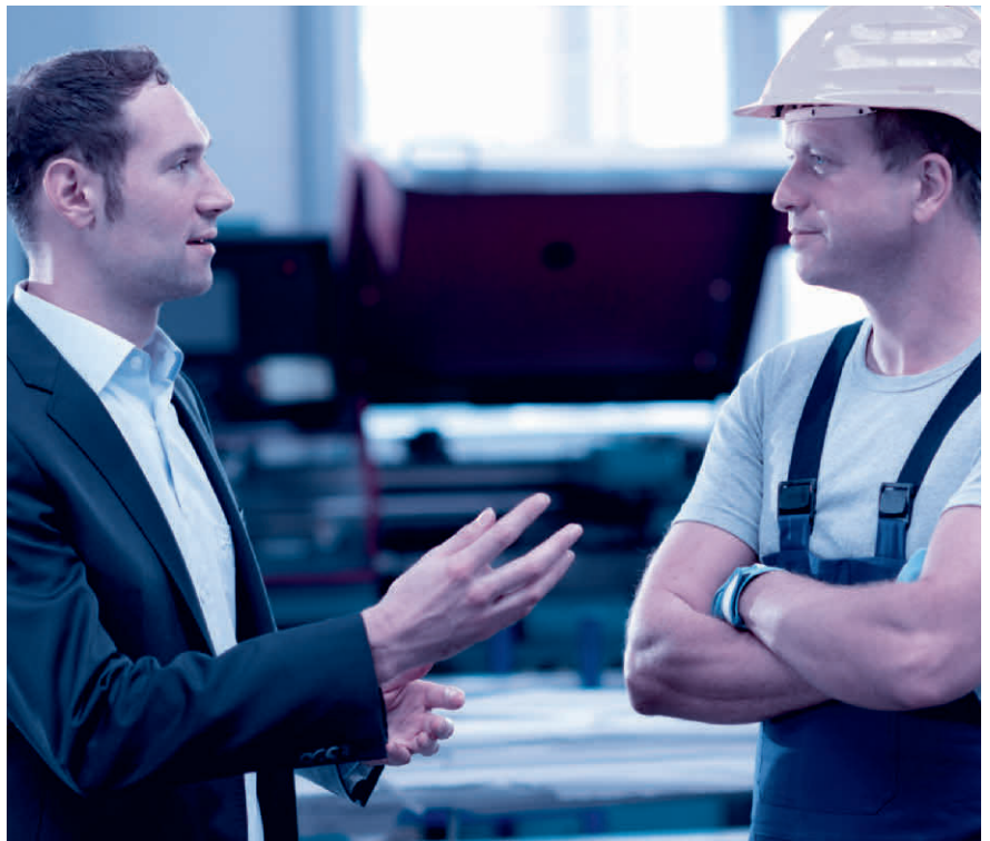
Das Mitarbeitergespräch ist keine Nebensache. Nehmen Sie sich Zeit und hören Sie zu.

Sinnvollerweise wird für das Mitarbeitergespräch zudem ein über die Jahre gleichbleibender Beurteilungsbogen mit einer Bewertungsskala (mit Smileys, Ampeln, Zahlen oder Buchstaben) verwendet.